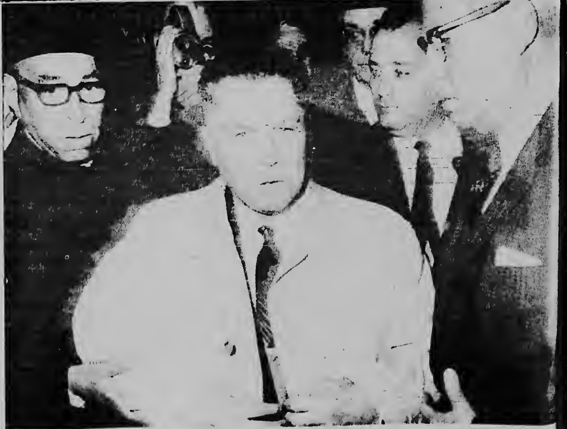
Cu un cara serio, Jimmy Hoffa, rondona pa su abogadonan y periodista, a yega e edificio di tribunal na Washington ayera y a entrega su mes y bai serrá pasobra el a purba di compra un hurado.

E ta un di e poco muhernan qu ta dedica nan mes na e musica relohera na Lima. E ot concursantenan a tuma casi dos ora of mas laat den e mes operacion.